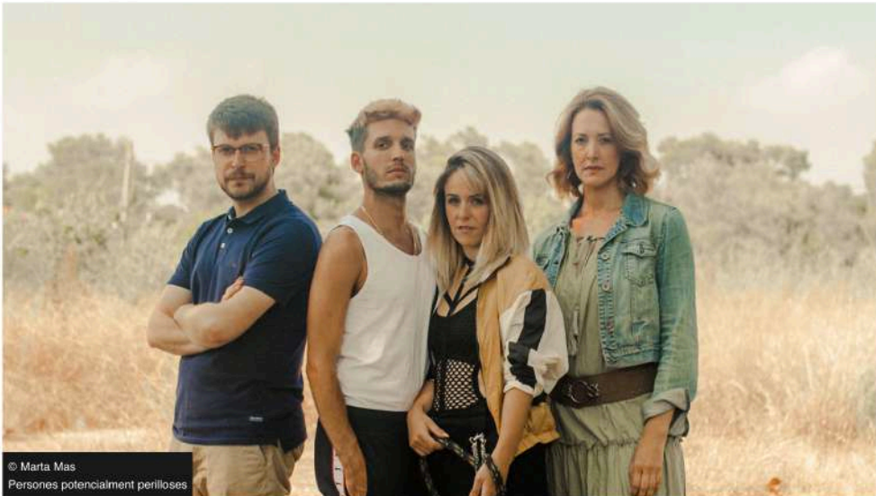
© Marta Mas Persones potencialment perilloses