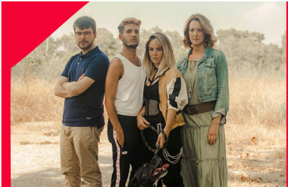
Persones potencialment perilloses

El Teatre Tantarantana ha presentat ja l'espectacle que obrirà la temporada 2019/20: Persones potencialment perilloses de Produït per H.I.I.I.T.