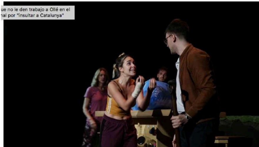
La tensión entre los dos hermanos va creciendo. / TANTARANTANA

Vivimos en un mundo convulso en el que la gente está preocupada por problemas políticos, laborales o sociales. Todo ello provoca que estemos con la sensibilidad a flor de piel y, a la más mínima, una simple chispa pueda provocar un incendio. Pero ¿cómo empieza todo? ¿qué origen tiene? ¿qué motivaciones? ¿por qué llegamos a extremos agresivos? En esa tarea están ocupados estos días los miembros de la compañía Produït per H.I.I.I.T representando en el Tantarantana Persones potencialment perilloses , un drama a ritmo de hip hop escrito y dirigido por Roger Torns, que intenta hallar el germen de la violencia.